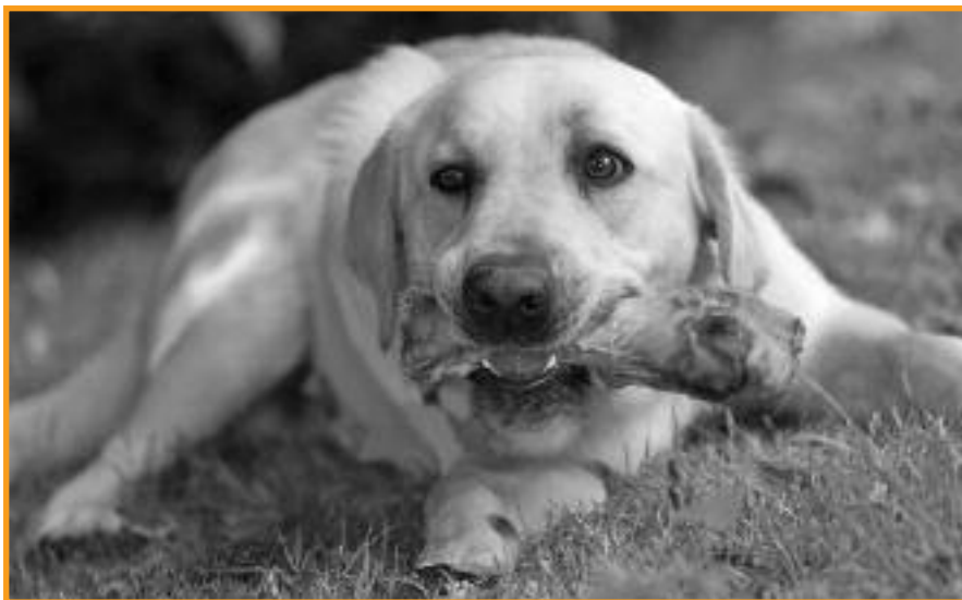
Feinschmecker - Knochen!

Jahr zu spüren, dass die allgemeine Spendenbereitschaft aufgrund der Finanzlage zurückgegangen ist. Und so machten wir uns alle Sorgen um das bevorstehende Weihnachtsfest. Zwar wissen wir Mitarbeiter selbst, dass man Tiere nicht vermenschlichen soll, aber trotzdem wurden bisher immer alle