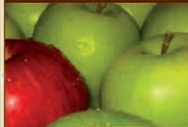
BIO ADULT mit Äpfel