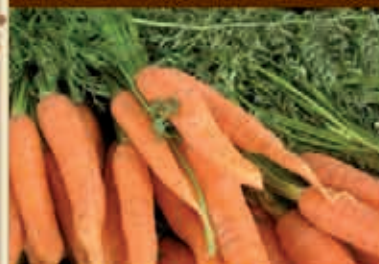
BIO PUPPY mit Karotten