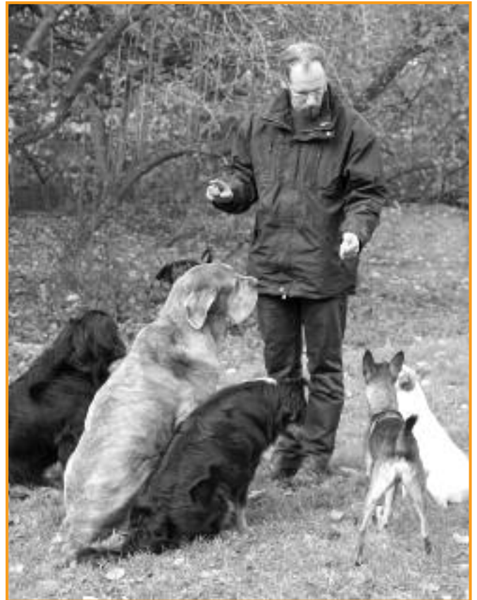
Die Hunde scheinen ihn zu verstehen und seine Worte interessant zu finden.

Statt des "Schau her" arbeiten viele Trainer auch mit Halti. Ich selbst bin kein Freund dieses Hilfsmittels. Erstens mag ich solche körperlichen Zwangseinwirkungen nicht. Außerdem sieht ein Hund mit Halti für viele Menschen direkt gefährlich aus. Was dazu führen könnte, dass Hund und Halter quasi diskriminiert werden. Wer hat es schon gerne, wenn Spaziergänger die Straßenseite wechseln oder ängstlich auf Seite gehen, wenn man mit seinem Hund vorbei kommt.