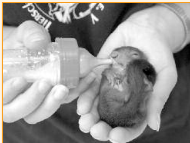
Die Fürsorge für die kleinsten bereitet Freude, erfordert aber größte Sorgfalt.

klame, und Amüsement stehen im Vordergrund.