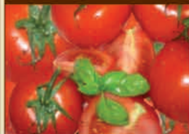
BIO SENIOR mit Tomaten