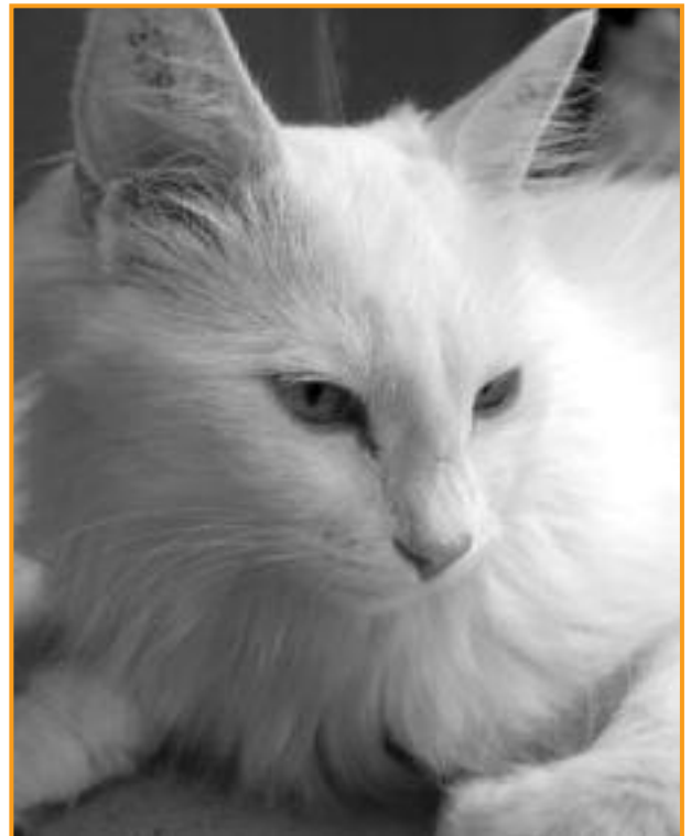
Tierheimkatzen warten auf Streicheleinheiten in den Gehegen

Vielleicht möchten auch Sie Seelenbalsam von vielen Alltagsituationen erfahren, dann melden Sie sich doch einfach im Tierheim. Wir freuen uns über zahlreiche fleißige Hände!