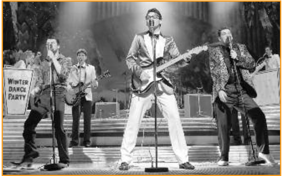
Mit viel Freude wird das Leben des Buddy Holly dargestellt.

„warum“ drängt sich zwangsläufig auf. Lächelnd meinte er, „dass drei Schachteln Zigaretten auch 15 Euro kosten würden, oder drei Long Drinks.“ Er verzichte gerne auf den Konsum dieser Sachen und möchte dafür diese Organisation unterstützen. Seine ernste und sehr erwachsene Seite kommt ebenfalls durch, als er seine Achtung vor dem Menschen Buddy Holly formuliert. Dazu muss man wissen, dass die Musik von Buddy Holly zur damaligen Zeit nicht erwünscht war. Er hätte sich anpassen können und einen anderen Stil adaptieren können, aber Buddy Holly kämpfte um die Anerkennung seines eigenen Stils. Er ließ sich nicht verbiegen. „Und wenn man überlegt, dass Buddy Holly in gerade einmal 2½ Jahren aktiver Schaffenszeit zur Legende wurde, dann kann man vielleicht erah-