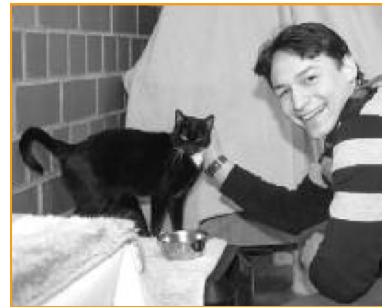
Hexe genießt die Aufmerksamkeit.

Nach diesem Gespräch wurde mir bewusst, dass ich mir mehr solcher verantwortungsbewusster junger Menschen wünschen würde, die im Vorfeld überlegen, ob sie einem Tier für ein Leben lang ein Zuhause bieten können.