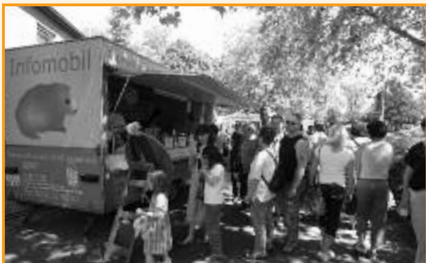
Das Infomobil wird gerne besucht

Der Frühling ruft und damit beginnt auch wieder die Zeit der Stadtteilfeste und Außenveranstaltungen. Unser Tierschutzverein besucht regelmäßig mit seinem „Infomobil“, einem umgebauten Verkaufsanhänger, diverse Feste, um das Tierheim und den Tierschutz bürgernah vor Ort zu bringen.