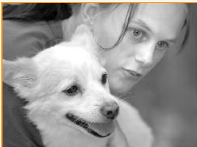
Die tägliche Verantwortung von Tierpflegern für ihre Schützlinge ist immer auch eine Herausforderung.