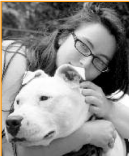
Ehrenamtliche und Mitarbeiter genießen die Nähe zum Tierheim Essen

Viele Menschen, die selber keine Tiere halten können, bieten daher ihre ehrenamtliche Hilfe in Tierheimen an.