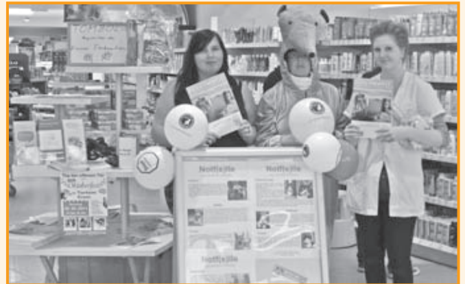
Auszubildende des dm-Marktes und Ehrenamtliche des Tierheims hatten viel Spaß am Welttierschutztag!

Zum Welttierschutztag am 4.10. fanden sich einige Mitarbeiter und Ehrenamtliche des Tierschutzvereins im dm-Markt an der Bamlerstraße ein. Auszubildende der Filiale hatten im Rahmen eines „Nachhaltigkeits-Projekts“ an die Essener Tierheimtiere gedacht und organisierten eine kleine Tombola und eine Standmöglichkeit für unseren Verein. Mit Erfolg: Neben einem Reinerlös von knapp 140 € konnten etliche Infomaterialien rund um das Thema Tierschutz verteilt und Einladungen für das Oktoberfest am 16.10. ausgesprochen werden. Dank noch einmal für die tolle Möglichkeit des „Tierschutz vor Ort!“