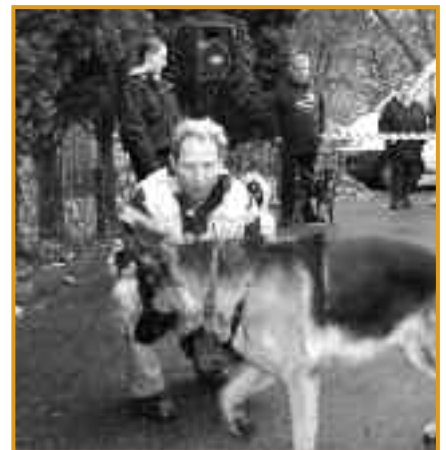
Tierheimhund außerhalb des Zwingers