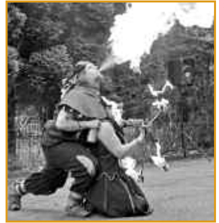
Bunte Attraktionen am Tag der offenen Tür

Der Schöpfungsgottesdienst findet traditionsgemäß unter Leitung von Pfarrer Steffen Hunder und der musikalischen Begleitung des Essener Gospelchors statt. Im Anschluss an den Gottesdienst bieten wir einen Pilgerweg per pedes, mit Kutschen und einem Bus zu unserem Tierheim an. Hier öffnen wir an diesem Tag die Pforten zum „Tag der offenen Tür“.