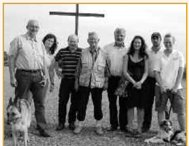
Auf der Suche nach einem geeigneten Veranstaltungsort