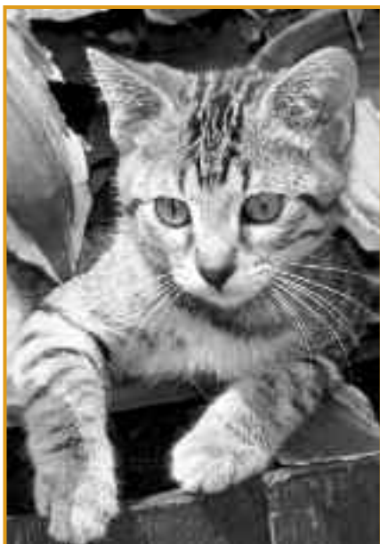
Viel Freude für 1,50 Euro am Tag

Viele Tierfreunde, die selbst mit einem Tier zusammenleben, haben noch nie wirklich nachgerechnet, was der Unterhalt des Hundes oder der Katze wirklich kostet.