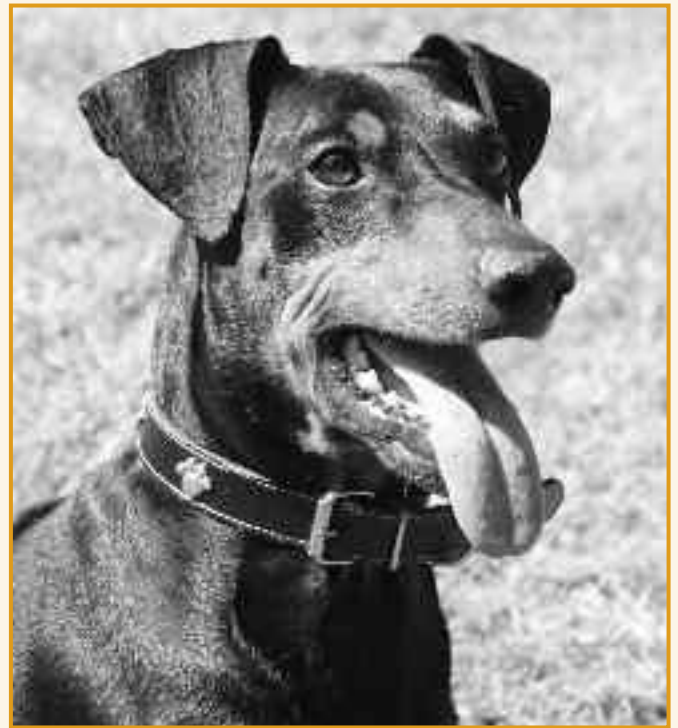
Quint beeindruckte bei dem Test "Warnweste" durch eine absolute Abklärtheit.

Wir: Halon, Paul und Quint sind alle im Tierheim Essen und suchen ein neues Zuhause!