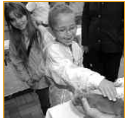
Kontaktaufnahme bei den Allerkleinsten