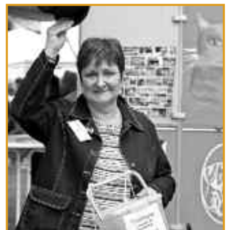
Losverkauf zugunsten des Tierheims