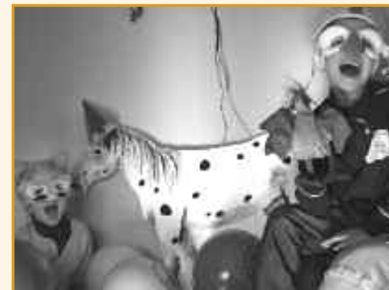
Mitarbeiter und Mitglieder freuen sich auf den Tierheimwagen.

Um Tiermotive auf Platten farbig zu gestalten bitten wir ferner um Spenden