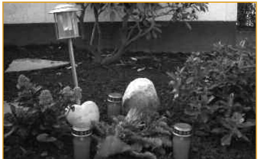
Liebevoll gestaltetes Tiergrab

Neben Informationen und Erläuterungen zum Thema „Trauer und Abschied“ gibt die Autorin auch Hilfestellungen, die den Betroffenen ermöglichen sollen aus dem Kreislauf von Trauer, Schmerz, Verzweiflung und Selbstvorwürfe wieder heraus zu finden und rät ihnen sich mit anderen Trauernden auszutauschen. Das Buch schafft es auf einfühlsame Art und Weise dieses sehr sensible Thema aufzugreifen, darauf einzugehen und es auch für Nicht-Tierbesitzer verständlich darzustellen. Ein tröstendes Geschenk für alle Menschen, die um ihr verstorbenes Tier trauern.