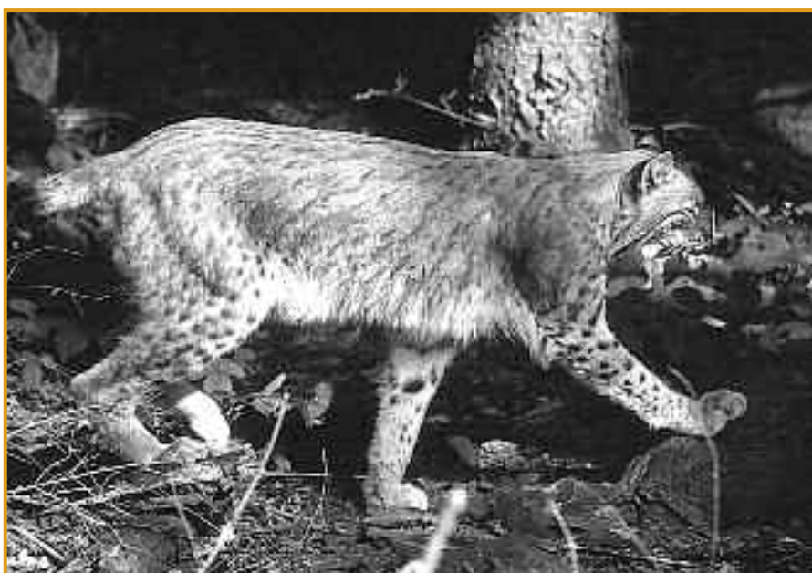
Ein Luchs auf der Pirsch. Im Nationalpark Harz wieder möglich.

Sein besonderes Merkmal sind sein unter Katzen völlig ungewöhnlicher Stummelschwanz und die Pinselfohren. Sein ganzer hochbeiniger Körperbau und die großen Katzenpfoten lassen ihn im Winter besonders schneegängig machen. In freier Natur können Luchse zwischen 5 und 10 Jahren alt werden, in Gefangenschaft ist ein Lebensalter von bis zu 15 Jahren möglich.