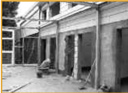
Universalräume in Planung