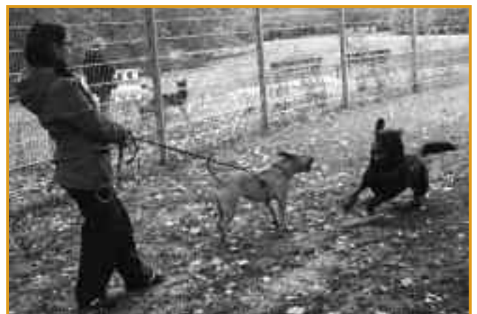
Ohne Worte - diese Situation kennt jeder Hundebesitzer.