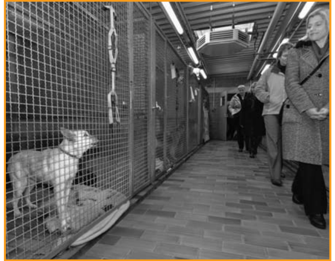
Rundgang durch das Tierheim.