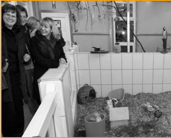
Kleintierbereich im Albert-Schweitzer-Tierheim.