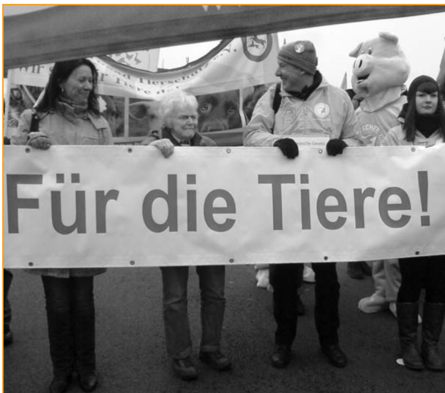
Der Deutsche Tierschutzbund in Berlin.