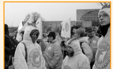
Das Tierheim Essen gegen Massentierhaltung.

Wasser zu springen, bevor Sie die Temperatur messen!“