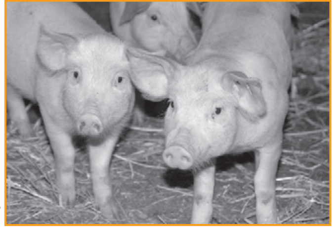
Süße Ferkel haben ein elendes Schweineleben

Verbotsliste entfallen. Zum Thema unbetäubte Ferkelkastration enthält der Gesetzentwurf zwar den Hinweis, dass es längst Alternativen gibt, aber trotzdem soll der grausame Eingriff noch bis 2017 erlaubt sein können. Auch das angekündigte Verbot der Kleingruppenkäfige für Legehennen ist gescheitert, weil die Bundesministerin die Umsetzung einer entsprechenden Bundesratsentscheidung verweigert.