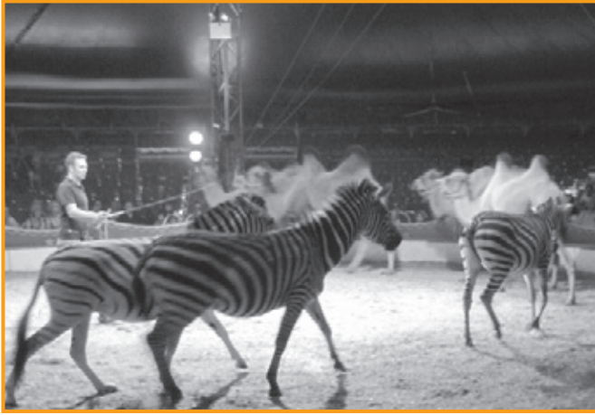
Dringend schutzbedürftig – Wildtiere im Zirkus