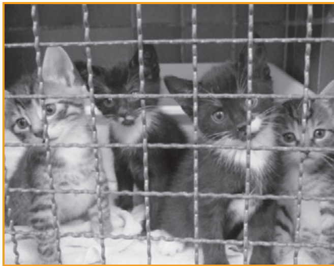
Viele hungrige Katzen sind zu füttern

Unser dickes Dankeschön an dieser Stelle an alle Helfer und Spender, die uns so schnell in dieser Notsituation geholfen haben!