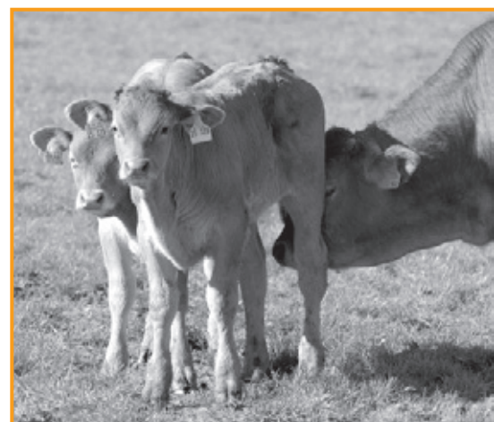
Allen Tiere soll es gut gehen – so das Ziel in NRW

Es ist grundsätzlich zu begrüßen, dass die zuständige Bundesministerin