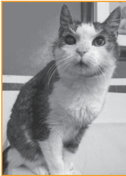
Tierheimkatze Guppy lebte in ihrer Gnadenbrotstelle richtig auf

Schäferhündin Ashra, ebenfalls im letzten Jahr in der WDR-Sendung „Tiere suchen ein Zuhause“ vorgestellt, hatte Glück. Eine liebevolle Tierschutzfamilie aus Bremen bot ihr eine Gnadenbrotstelle inmitten einer kleinen vier- und dreibeinigen Tierschutzfamilie „samm- lung“. Das Glück währte zwar nur ein paar Monate, doch als Ashra dann endgültig aus Krankheitsgründen eingeschläfert werden musste, konnte sie auf mehrere Wochen intensives Leben inmitten ihrer eigenen Familie zurück-