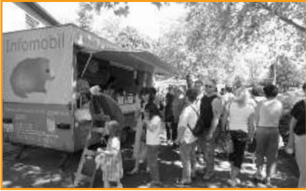
Das Infomobil wird gerne besucht

Der Frühling ruft und damit beginnt auch wieder die Zeit der Stadtteilfeste und Außenveranstaltungen. Unser Tierschutzverein besucht regelmäßig mit seinem „Infomobil“, einem umgebauten Verkaufsanhänger, diverse Feste, um das Tierheim und den Tierschutz bürgernah vor Ort zu bringen.