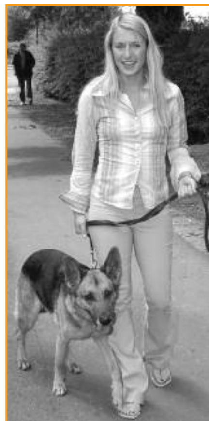
Stefanie Hertel unterstützt ihr Tierheim vor Ort auch aktiv.

Privat sind die Natur und ihre Heimat ihr Lebenselixier und gleichzeitig Ruhepol. Ihr eigener Freigänger-Kater „Rudi“ gehört dazu. Wenngleich er dem Star eigene Allüren macht: „Wenn mein Mann und ich ein paar Tage weg sind, kümmern sich Nachbarn um Rudi. Aber wehe, wir sind wieder da. Er ist dann eingeschnappt und guckt demonstrativ gegen die Wand!“ Den Haustiger interessiert der Erfolg von Stefanie Hertel nicht, seine Welt ist in Ordnung, wenn sein berühmtes Frauchen mit Mann und Tochter zuhause sind und genügend Streicheleinheiten übrig haben.