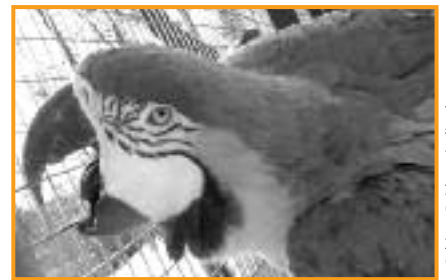
Ein Leben in Gefangenschaft ...