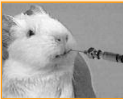
Für die Menschen scheint es ethisch keine Grenzen bei der zumutbaren Belastung für Tiere zu geben.