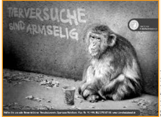
Ohne Verbandsklagerecht sind die Tiere schutzlos, denn Tierschützer können nicht klagen.