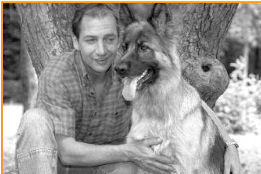
Urlaub - endlich Zeit für den Hund, da soll er nicht zu Hause bleiben.