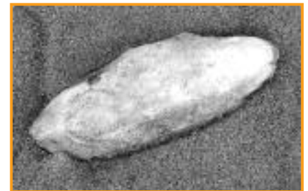
Das ist ein Tintenfisch-Schulp. Du kannst sie häufig am Strand finden.

Sepias haben gute Linsenaugen, mit denen können sie unter Wasser fast so gut sehen wie Wirbeltiere.