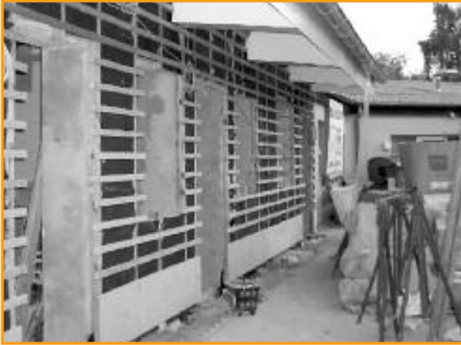
Viele Tierheime müssen saniert werden – wer bezahlt die Rechnung?