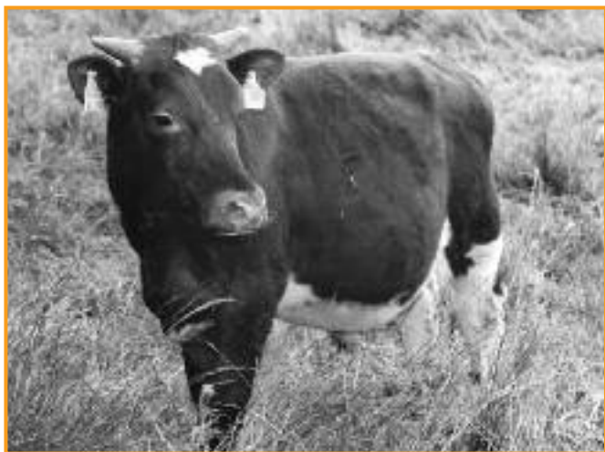
Artgerechte Haltungsformen in der Landwirtschaft – sind das Ziel der Grünen.