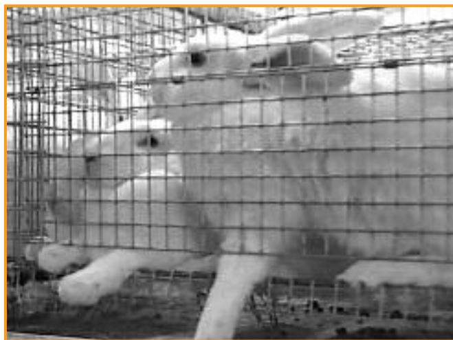
Bis heute ist die Haltung von Kaninchen in der Industriemast nicht geregelt.