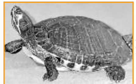
... ist im Käfig oder Bassin grauenvoll.