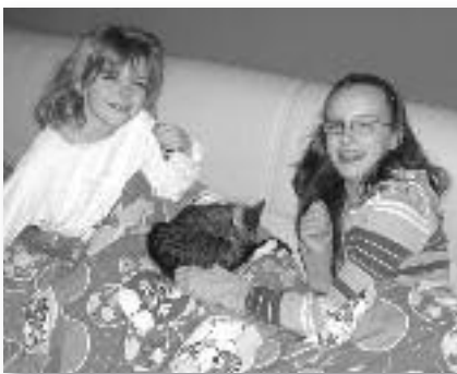
Nala und Kids

hier wie gesagt unsere ersten gemeinsamen Tage mit Caryn heute allerdings Nala :) Sie hat erst einmal ihr neues zuhause gut durchstöbert, aber schon nach kürzester Zeit hat sie es sich überall bequem gemacht, und schon so einige Plätze gefunden. Diese Katze ist einfach unglaublich...Lieb, verspielt, verschmusst, neugierig und total Kinderlieb! Allerdings hat sie eine kleine Macke :) jeden Morgen pünktlich um 4.00 Uhr Nachts...kommt sie zu mir ans Bett und schnurrt mir was vor und tänzelnd mit ihren pfötchen durch mein Gesicht, OHNE Krallen versteht sich, dann wird sie bissl gekuschelt bis sie sich denn auch einrollt und schläft.